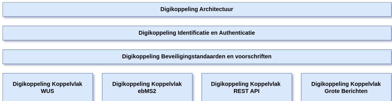
Figuur 1 Onderdelen Digikoppeling specificatie

De onderstaande figuur geeft de verschillende onderdelen van de digikoppeling standaard weer: