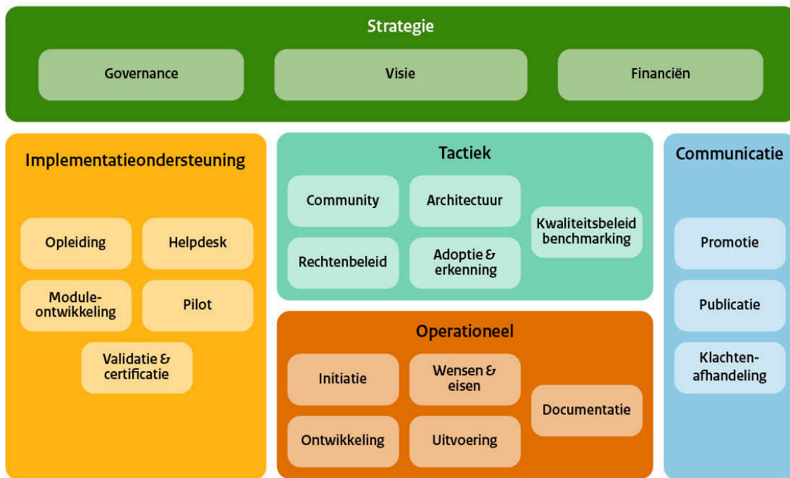
Figuur 2 BOMOS Activiteitendiagram